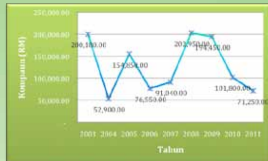
Jumlah kompaun tahun 2003-2011