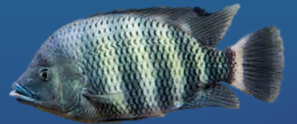
Spesies: Heterotilapia buttikoferi