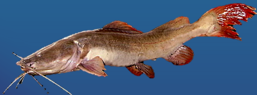
Spesies: Hemibagrus wyckiioides