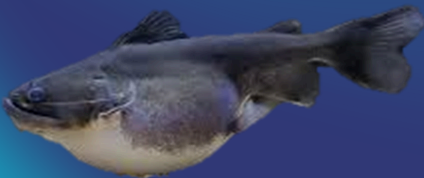
Spesies: Asterophysus batrachus