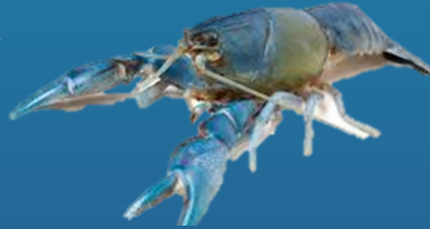
Spesies: Cherax destructor