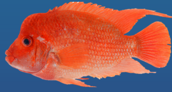
Spesies: Amphilophus citrinellus