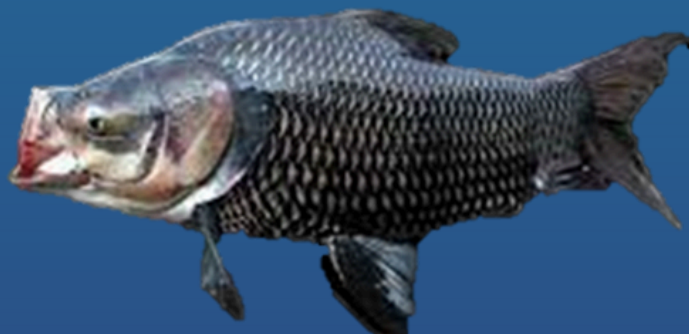
Spesies: Catlocarpio siamensis